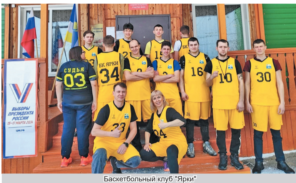
Баскетбольный клуб "Ярки"

Эти результаты являются заслуженной наградой для участников, их командного духа и усердной работы. Мы поздравляем победителей и желаем им продолжать вести свои коллек-